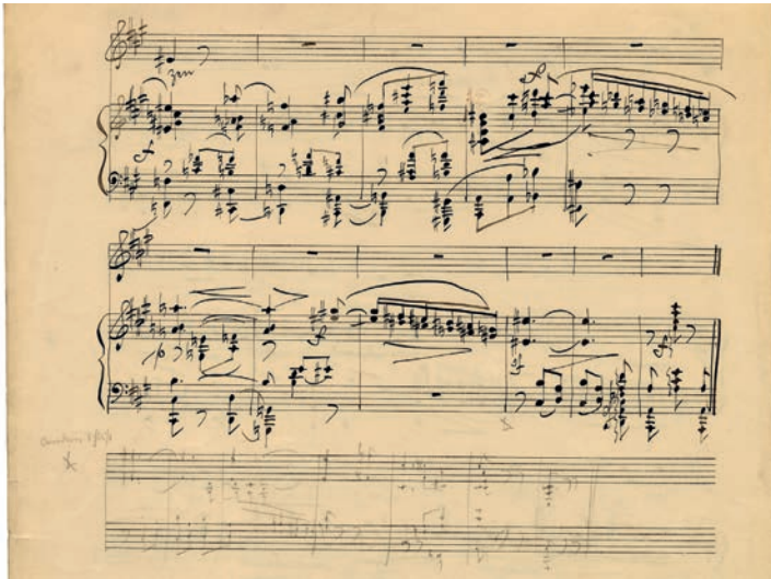
Abbildung 3: Dritter Schluss von Sehnsucht im Partitur-Auszug 59

Aus der Particellerstniederschrift 60 entstand in einem nächsten Schritt, bei dem Schönberg wiederum mit wenigen Korrekturen auskam, die erste Partiturreinschrift, d. h. in diesem Fall die Orchesterfassung. 61 Aus diesem Manuskript wurde dann der Partitur-Auszug 62 erstellt, an dessen Ende Schönberg in Bleistift einen dritten Schluss einfügte (Abb. 3). Diesen schrieb er danach auf einem zusätzlichen Notenblatt in der finalen instrumentierten Fassung auf, schnitt das Blatt zurecht und überklebte damit die letzten Takte der ersten Partiturreinschrift, was in Abb. 4 mit einem Pfeil gekennzeichnet ist.